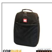
HPRCCB3500 CORDURA BAG