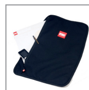
HPRCORG3500 LID ORGANIZER