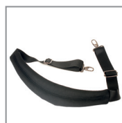
HPRCSTRAP FOR BAG